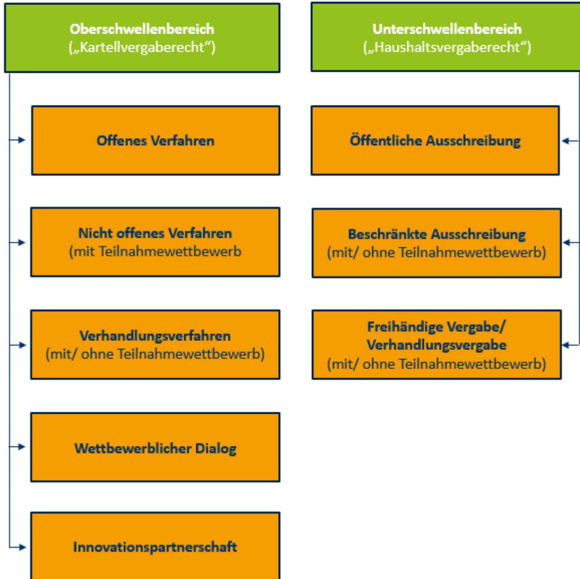
Abbildung 1: Verfahrensarten im Vergaberecht (NAUMANN 2018, S 30)

Im BIBB wurden im Jahr 2021 Forschungsaufträge sowohl als offenes Verfahren als auch im Rahmen von Verhandlungsverfahren vergeben (siehe Tabelle 1). Die Verhandlungsvergaben wurden in einem Verfahren in mehreren sogenannten Losen veröffentlicht. Die Auflistung der Projekte erfolgt chronologisch nach dem Zeitpunkt ihrer Veröffentlichung.